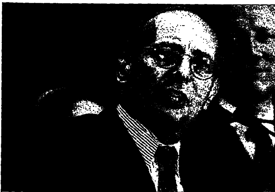
السيناتور الجمهوري جون ماكين يخطب أمام مجلس الشيوخ في واشنطن

واشنطن - قال نائب رئيس مجلس الشيوخ الديمقراطي جون ماكين إن مكاسب الديمقراطيين في الكونغرس قد تنقذ كليتون من الاستقالة. وقال ماكين في خطاب أمام مجلس الشيوخ في واشنطن إن الديمقراطيين حققوا مكاسب هائلة في الكونغرس، مما يجعله أكثر توازناً من أي وقت مضى. وأضاف ماكين أن الديمقراطيين حققوا مكاسب هائلة في الكونغرس، مما يجعله أكثر توازناً من أي وقت مضى. وأضاف ماكين أن الديمقراطيين حققوا مكاسب هائلة في الكونغرس، مما يجعله أكثر توازناً من أي وقت مضى.